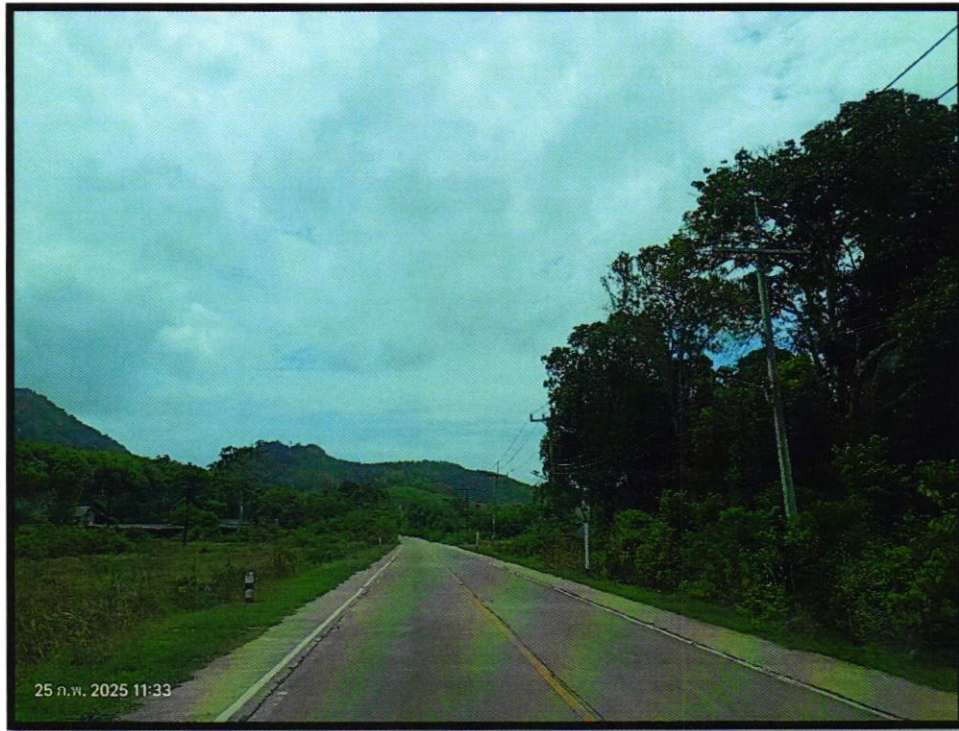
.โครงการพัฒนาเส้นทางเชื่อมโยงการท่องเที่ยวภายในเกาะลันตากิจกรรมปรับปรุงเสริมเหล็ก สายสามแยก สะพานไทร-ทุ่งหีบึง