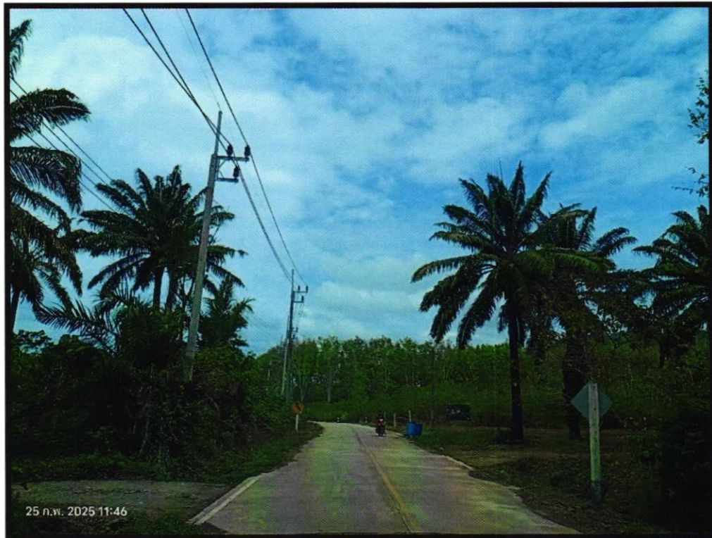
.โครงการพัฒนาเส้นทางเชื่อมโยงการท่องเที่ยวภายในเกาะลันตากิจกรรมปรับปรุงเสริมเหล็ก สายสามแยก สะพานไทร-บ่อขยะ